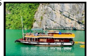
Unser Boot ankert in Buchten abseits der Touristenhorden

Am Morgen fahren wir mit einem Minibus an die Meeresküste. Der Transfer dauert 2.5 Std. Von dort aus steigen wir auf eine Fähre, die uns nach kurzer Fahrt auf eine Insel bringt. So gelingt es uns, die riesigen Touristen-Ströme der Halong Bucht zu umgehen. In einer kleinen Hafenbucht liegt unser privates Hotelschiff vor Anker. Wir gleiten durch einsame Buchten und Fjorde und bewundern die atemberaubende Gegend um uns herum. In einer seichten Bucht geniessen wir das feine Mittagessen an Bord unseres traditionellen Holzbootes. Nach einer kurzen "Siesta" geht es weiter durch ein Gebiet mit tausenden steil aus dem Wasser ragenden Karst-Inseln (ein Teil der Bucht ist UNESCO-Schutzgebiet). Wir besuchen einen unberührten Abschnitt der Halong Bucht, wo wir kaum andere Schiffe antreffen. Unterwegs sehen wir schwimmende Fischerdörfer und Perlenfarmen. Mit dem Kajak erkunden wir eine atemberaubende Lagune, welche nur durch einen Tunnel per Boot erreicht werden kann. Dank guten Kontakten zur Küstenpolizei sind wir die einzigen westlichen Leute, die diese unter Naturschutz stehende Lagune besuchen dürfen! Zum Schlafen stoppen wir in einer einsamen Bucht, wo nur unser Kapitän die Bewilligung zum Ankern hat. Wir übernachten in einfachen Bootskajüten oder, wer lieber möchte, auf dem Schiffsdeck unter dem strahlenden Sternenhimmel.