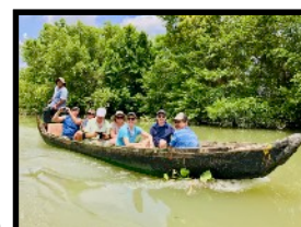
Mit kleinen Booten erkunden wir die schmalen Mekong Kanäle