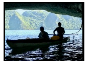
Mit dem Kajak in die Lagunen