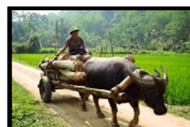
Dieses Transportmittel benötigt nur Gras und kein Benzin