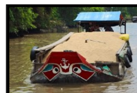
Typisches Transport-Schiff mit aufgemalten Augen