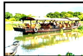
Per Holzschiff quer durch das riesige Mekong-Delta

Gleich nach dem Frühstück stossen wir mit dem Bus in das Mekong Delta vor. Nach 3 Stunden Fahrt erreichen wir eine grosse Stadt im Mekong Delta, wo ein Freund des Reiseleiters mit dem Boot auf die Gruppe wartet. Wir verladen unser gesamtes Gepäck auf das schöne Holzboot und bummeln dann gemeinsam durch den Früchte-Markt. Dort kaufen wir verschiedene unbekannt tropische Früchte, um diese dann während der langen Bootsfahrt zu degustieren. Auf dem Wasserweg dringen wir nun noch weiter ins Flussdelta vor und gleiten dabei durch endlos lange Kanäle, direkt vorbei an Häusern und Gärten. Das Geschehen im lebhaften Mekong-Delta bietet unglaublich viele tolle Fotomotive. Doch wenn einem mehr nach Entspannung ist, kann man sich auch herrlich in einer Hängematte, auf dem Boot schaukelnd, entspannen und dabei die vorbeiziehende Kulisse beobachten. Rechtzeitig zum Sonnenuntergang erreichen wir eine kleine Lodge, die direkt am Fluss gelegen ist und welche liebevoll von einer Familie geführt wird. Die gesamte Gartenanlage liegt herrlich neben einem Kanal des Mekong-Flusses. Zum Abendessen gibt es leckere Spezialitäten serviert direkt auf der Fluss-Terrasse. Nach dem Abendessen kann man es sich in den Hängematten direkt am Kanal gemütlich machen, ein paar kühle Drinks geniessen und versuchen die herumfliegenden Glühwürmchen zu spotten.