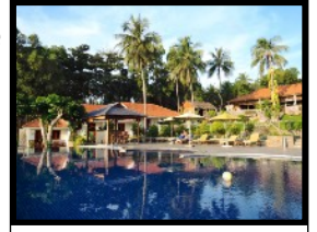
Das grosszügige Resort ist eine wahre Oase der Ruhe

Vom Flughafen in Can Tho fliegen wir 45 Minuten um die Insel Phu Quoc zu erreichen. Nach der Landung am Flughafen fahren wir direkt zu unserer idyllischen Bungalowanlage mit einem privatem kleinen Sandstrand. Unser Resort liegt abseits des Massentourismus und die ganze Anlage ist harmonisch in die umliegende Natur eingebettet. Ein perfekter Ort, um die vielen Erlebnisse und Abenteuer der letzten Wochen zu verdauen. Man kann am Infinity Pool oder Sandstrand schwimmen und faulenzen oder sich mit professionellen Massagen so richtig verwöhnen lassen. Am Abend schlürft man feine Cocktails, genießt lokales Essen und bewundert die spektakulärsten Sonnenuntergänge von ganz Vietnam.