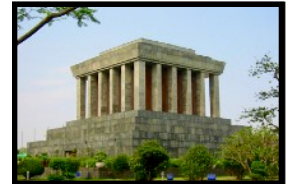
Kolossale Grabstätte vom Landesvater „Ho Chi Minh“