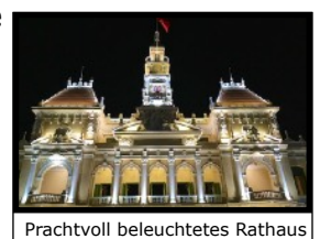
Prachtvoll beleuchtetes Rathaus