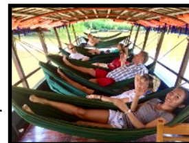
Entspannung pur; in der Hängematte auf dem Mekong