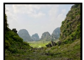
Wanderung durch verwunschene Karstlandschaften & Täler

Erst vor kurzer Zeit wurde diese Gegend ins Unesco-Weltkultur Erbe aufgenommen und deshalb nimmt der Massentourismus leider stetig zu. Doch wir entfliehen dem ganzen Rummel und erkunden die umliegende Gegend mit duzenden versteckte Tälern, malerischen Weihern, Fischfarmen und Reisfeldern. Um diese atemberaubende Karstlandschaft zu erkunden, machen wir ein Kombinations-Tour mit Minibus, Fahrrad & Spazieren. An einem Weiher steigen wir auf kleine Ruderboote und nach 15 Min. Fahrt gelangen wir zu einer Felswand, die im inneren eine Wasserhöhle verbirgt. Nach einem kurzen Marsch in der Höhle, gelangen wir an einen unterirdischen Fluss. Erneut steigen wir auf Boote und gleiten noch tiefer in die Höhle hinein und bestaunen die bizarren Tropfstein-Formationen. Zum Mittagessen lädt uns der lokale Guide in sein Haus ein, wo wir eine typische lokale „Hotpot“-Mahlzeit serviert bekommen. Am Nachmittag erforschen wir per