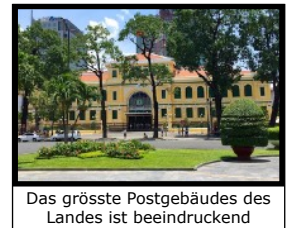
Das grösste Postgebüdes des Landes ist beeindruckend

Wir transferieren mit dem Minibus an den Danang Flughafen und von dort geht es mit dem Flugzeug weiter nach Ho Chi Minh City, in die grösste Stadt des Landes. Unser Hotel liegt perfekt gelegen, um zu Fuss alle interessanten Stadtteile erkunden zu können. Nach dem Einchecken im Hotel unternehmen wir einen kurzen Erkundungs-Spaziergang durch die pulsierende Stadt, damit du dich besser in der riesigen Stadt orientieren kannst. Der Reiseleiter weist dich auf die wichtigsten Sehenswürdigkeiten hin und gibt Empfehlungen für die besten Bars und Clubs, die ein „verrücktes“ Nachtleben garantieren. Während dem Spaziergang gehen wir zu einer bekannten Suppenküche um dort eine legendäre leckere „Pho“-Suppe zu probieren. Der Rest des Tages ist zur freien Erkundung und man kann aus vielen Optionen auswählen was einem am meisten Freude bereitet.