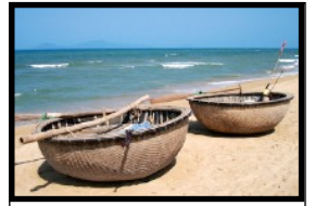
Traditionell geflochtene Korb-Fischerboote

Die Insel steht erst am Anfang, um sich dem Tourismus zu öffnen. Seine Inselbewohner pflegen noch immer dieselben Traditionen wie seit Jahrhunderten. Im nördlichen Teil gibt es absolut unberührte Urwälder, die unzählige bedrohte Pflanzen, Bäume und Tierarten beheimaten. Die Fischerdörfer hier zählen zu den schönsten und buntesten in ganz Asien. Ausserdem ist die Insel weit über die Landesgrenzen bekannt für den hervorragenden Pfeffer, der hier wächst, und die Herstellung einer der weltbesten Fischsaucen. Dein Reiseleiter gibt dir Tipps, wie du deine Freizeit auf der Insel gestalten kannst. Wir geniessen ein letztes gemeinsames Abendessen bevor wir uns voneinander verabschieden müssen.