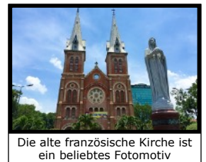
Die alte französische Kirche ist ein beliebtes Fotomotiv