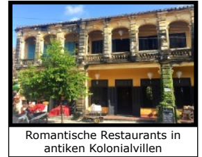
Romantische Restaurants in antiken Kolonialvillen

Nochmals verbringen wir einen ganzen Tag, damit du diese faszinierendste und altertümlichste Stadt Vietnams ausgiebig erkunden kannst. Wer möchte, kann auch Velo- und Bootstouren in die schöne Umgebung unternehmen oder am nur 4 Km entfernten Sandstrand schwimmen gehen.