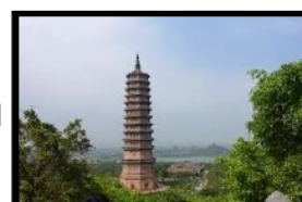
Schöne Aussicht auf die höchste Pagode von Vietnam