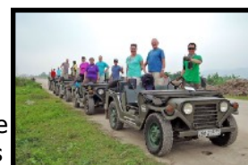
Unterwegs in unwegsamem Gelände mit Armee-Jeeps