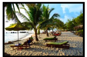
Entspannung und Erholung am malerischen Hotelstrand

Möchtest du noch einige Tage länger in „Phu Quoc“ verweilen? Natürlich gibt es unzählige Hotels in jeder Preisklasse. Falls du jedoch nicht das Hotel wechseln möchtest, können wir für dich noch zusätzliche Übernachtungen in unserem Gruppenhotel buchen. (Siehe Infos unter REISE-FAKTEN VIETNAM "Zusätzliche Übernachtungen".)