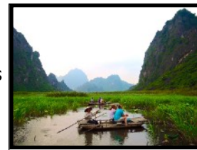
Auf der Affen-Pirsch im Sumpftal

Bambus-Boot ein anderes abgeschiedenes Tal, welches bis heute vom Tourismus verschont ist, und in das man nur auf dem Wasserweg gelangen kann. Durch gute lokale Kontakte ist es uns möglich mit unseren Reisegruppen diese einmalige Sumpflandschaft zu besuchen. Das kleine Tal ist das letzte Rückzugsgebiet auf der Erde, wo es noch eine kleine Population von 200 bedrohten „Delacour-Languren“ Affen gibt. Die Farbzeichnung des Fells ist sehr amüsant, weil es aussieht als ob die Affen eine weisse Unterhose tragen :-). Dieses Feuchtgebiet ist ausserdem auch die Heimat von vielen seltenen Vogelarten. Die Landschaft ist übersät mit Schilf und Wasserpflanzen. Die Schönheit und Ursprünglichkeit dieses märchenhaften Tals wird dich bestimmt verzaubern! Nach der Rückkehr in unsere Unterkunft, erhalten wir von unserer Gastfamilie ein leckeres vietnamesisches Nachtessen serviert.