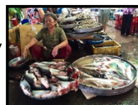
Verkäuferin hat den beliebten Penguasius-Fisch im Angebot