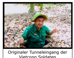
Originaler Tunnelleingang der Vietcong Soldaten

Wir verbringen einen vollen freien Tag, um die grösste Stadt des Landes zu erkunden. Amüsiere dich ab dem Chaos, wenn tausende Motorräder durch die Strassen brausen. Am Nachmittag fahren wir zu den legendären „Cuchi“-Tunnels, wo sich damals der Vietcong in riesigen Tunnel-Labyrinthen versteckte. Dabei folgen wir aber nicht der üblichen Route der riesigen Touristenströme, sondern fahren in eine andere weiter entfernte Tunnelzone, wo es weniger Touristen gibt. Von einem lokalen Guide dessen Eltern mehrere Jahre in den Tunnels gelebt haben, erfahren wir unter welch harten Bedingungen die tapferen Guerillas damals gelebt haben und wie die ganze Tunnel-Gemeinschaft funktionierte. Wir erkunden die drei Tunnel-Levels und jeder kann selber entscheiden, wie lange und wie tief man in die Tunnels vordringen möchte. Am späten Nachmittag fahren wir wieder zurück in unsere Unterkunft. Abends lässt es sich herrlich durch die quirligen Strassen und Parks bummeln. Überall gibt es gemütliche Restaurants, Bars und Cafés. Das Herz der Shopping-Fans schlägt höher bei einem Besuch der zahlreichen Märkte. Hier gibt es tolle Souvenirs für wenig Geld zu erhandeln. Nach dem Nachtessen kann man einen Cocktail schlürfen auf der gleichen Hotelterrasse, wo damals die US-Kriegsgeneräle ihre geheimen Taktiken besprachen.