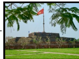
Der legendäre Flagenturm der Kaiser-Zitadelle

Am Morgen erreichen wir die ehemalige Kaiserstadt und besprechen was diese geschichtsträchtige Stadt zu bieten hat und was du in deiner Freizeit alles anstellen kannst. In der Umgebung gibt es dutzende prunkvolle Kaisergräber zu besichtigen. Die Küche von Hue ist bekannt für die vielseitigen Gerichte und Spezialitäten der damaligen Kaiser. Die Köche mussten damals für die Kaiser permanent neue Gerichte erfinden und kreieren. Heute kannst du in einem der unzähligen Strassenrestaurants dinieren und die lokalen Köstlichkeiten probieren. Gemäss den Einheimischen ist die Küche von Hue die schmackhafteste des Landes.